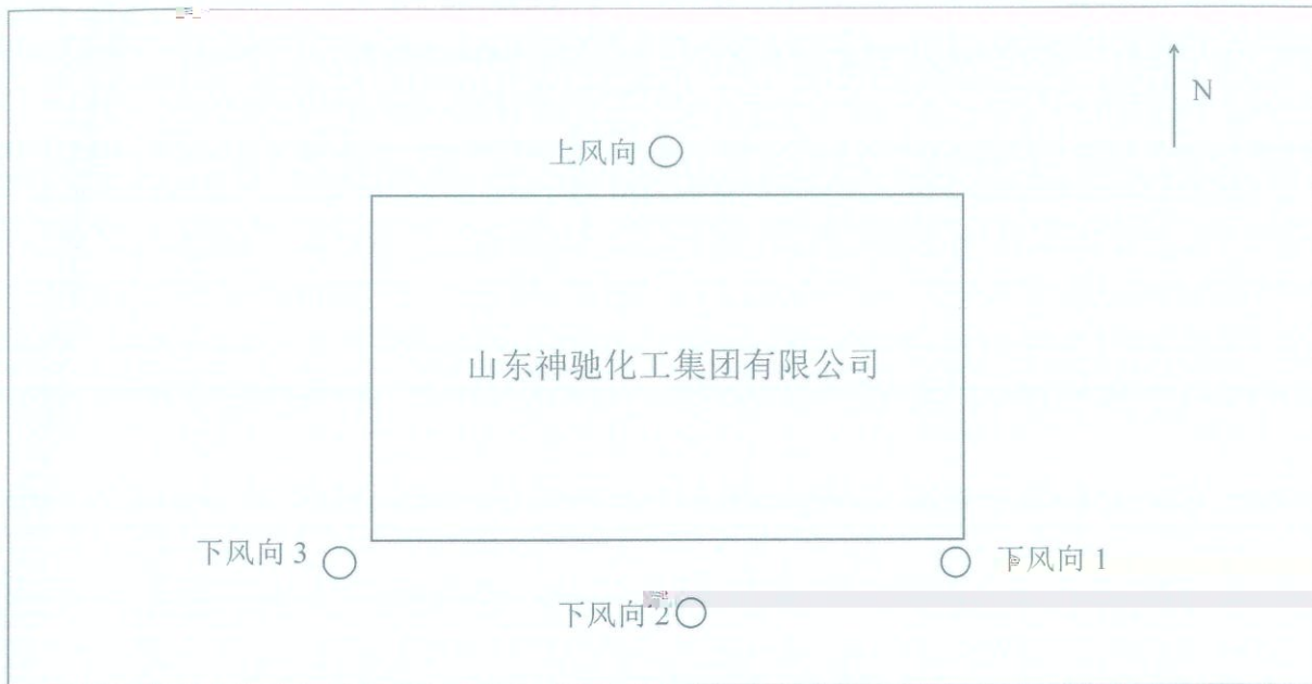
图1 无组织废气采样布点图